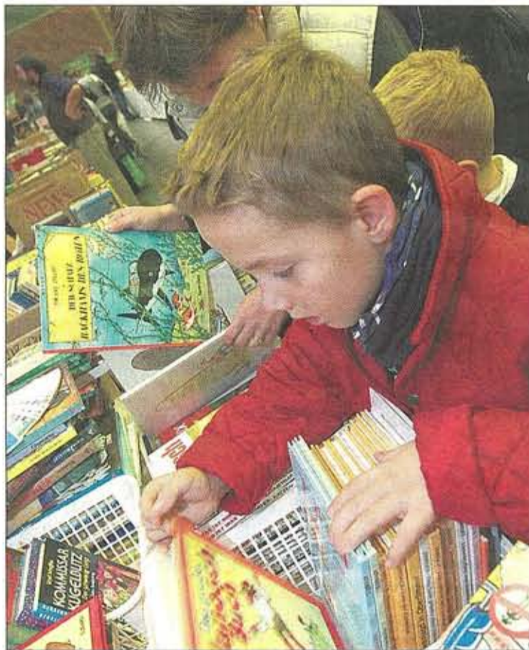
Le centre Prince Henri est entièrement dédié aux enfants

Une popularité miraculeuse qui ces dernières années attire 8.000 à 12.000 personnes – le marché du