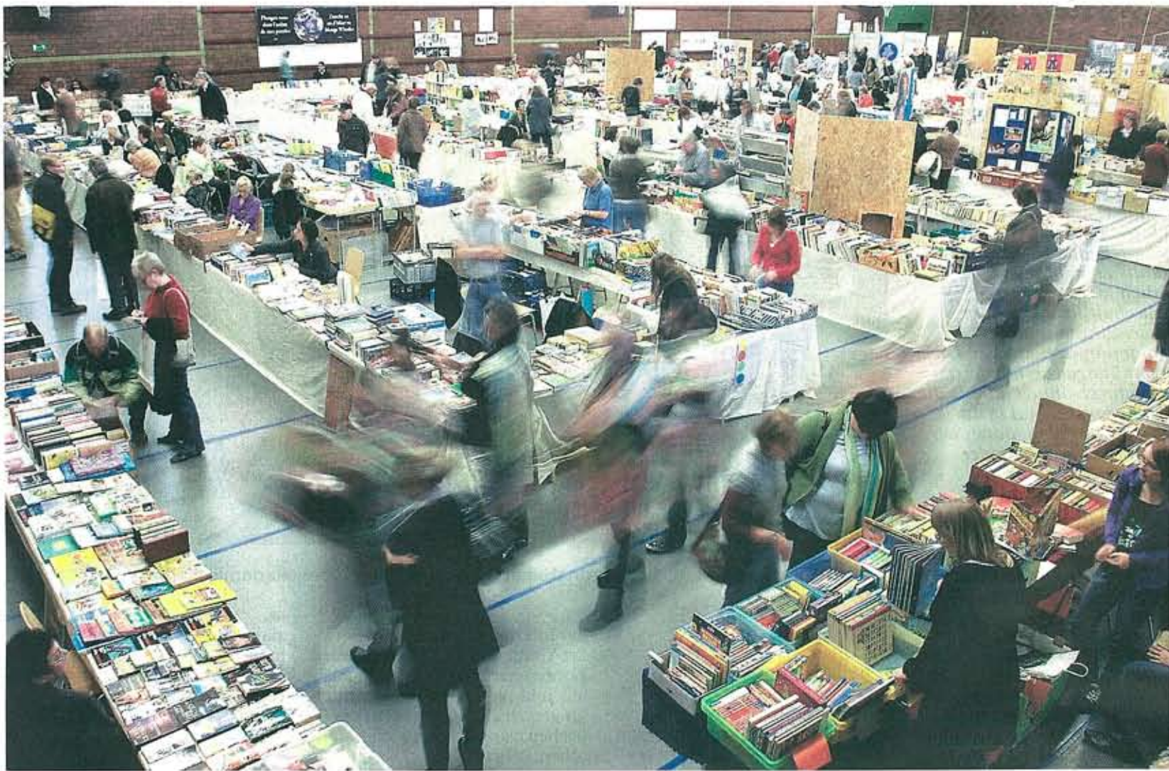
Es ist Vormittag und noch ruhig, nur ein paar Schnäppchenjäger huschen von Stand zu Stand ...

Die diesjährige Anthologie, die bereits zum sechsten Mal von der Gemeinde herausgegeben wurde, widmet sich ebenfalls dem Sport und seinen Tücken. In „Konterla-