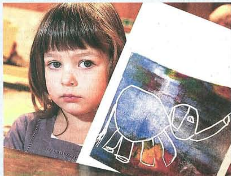
Der Elefant ist toll geworden ...

Bloß nicht drängeln, die jungen Autoren wissen selbst, wann die Geschichte zu Ende erzählt ist. Aber trotzdem sollten sie dabei bleiben, unnötige Schaffenspausen können den Spaß verderben.